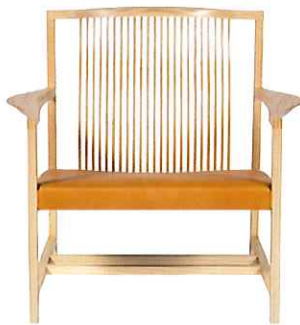
Easy Chair W84×D75×H77.5・SH37cm ¥529,200