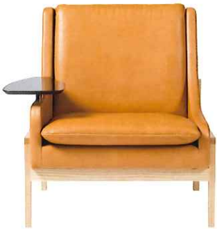
Salon Chair W72×D78×H78・SH38cm ¥680,400