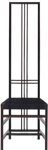
Highback Chair W44×D44×H140・SH45cm ¥756,000